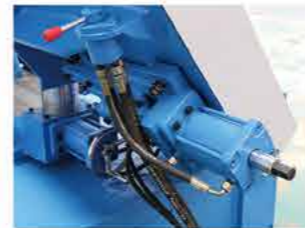
● 锯带全液压夹紧 Saw blade hydraulic clamping