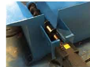
● 排屑器 Hydraulic chip conveyor