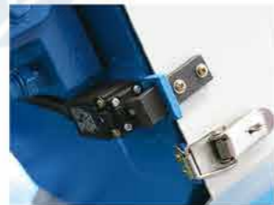
● 防护罩断电保护 Protective cover power failure protection