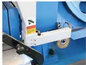
● 锯带防护罩保护 Saw blade cover protection