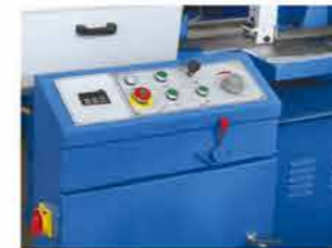
● 锯带无极调速 Saw blade variable speed