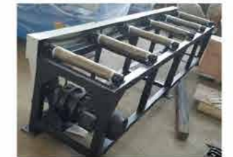
● 电动送料架 Electric feed rack