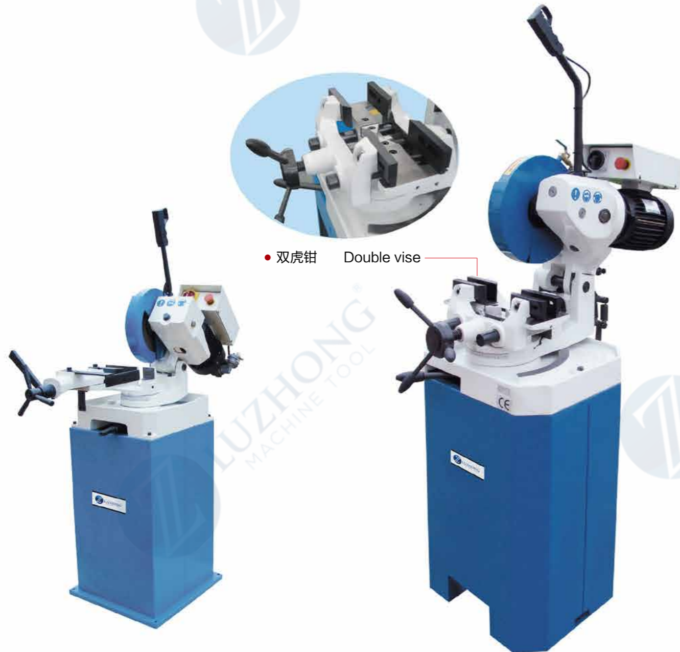
• 双虎钳 Double vise