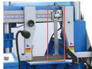
● 快降保护 Fast down protection