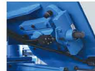
● 锯带断开保护 Saw blade broken protection